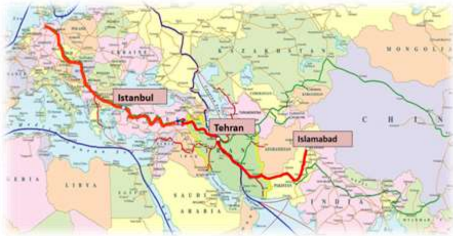
تصویر ۴، کریدور اسلام‌آباد، تهران، استانبول

ایران چندان تمایلی ندارد. از طرفی دیگر اردوغان در سال‌های اخیر از برنامه این کشور برای عضویت در سازمان همکاری شانگهای صحبت کرده که در صورت درخواست ترکیه برای عضویت، به موافقت همه کشورها از جمله ایران نیاز خواهد بود. در صورت بروز این اتفاق، جمهوری اسلامی ایران این فرصت را خواهد داشت که در آینده از این فرصت در جهت امتیازگیری از ترکیه در زمینه‌های گوناگون از جمله همکاری برای ترانزیت کالا در کریدورهای عبوری از ایران استفاده کند.