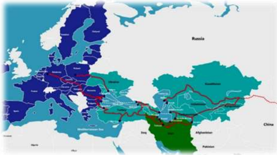
تصویر ۲، کریدور ترانسیکاسپا

شانگهای، با چین و جمهوری های آسیای میانه در جهت ترانزیت کالا و بار از طریق مسیر جایگزین این کریدور رایزنی کند.