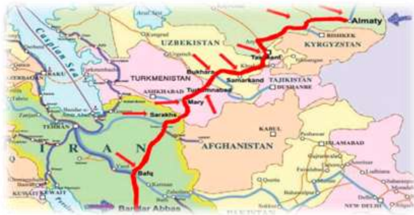
تصویر ۵، کریدور بندرعباس-آلماتی